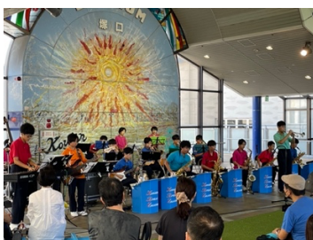
6,7月スカイコム広場でのプレイイベント

また現在は塚口を中心に開催しておりますが、地域を広げてジャズの街尼崎を目指して地域活性化・文化向上に繋がる音楽イベントを目的として発展させていきたいと考えております。