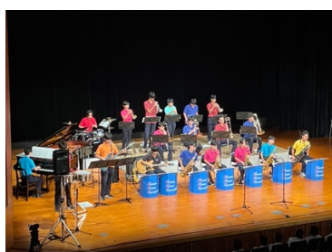
8月11日ピッコロ大シアター