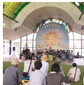
8月11日スカイコム広場