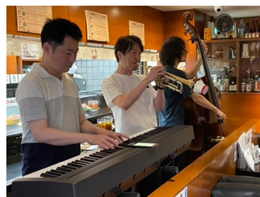
8月11日塚口商店街でのジャズナイト